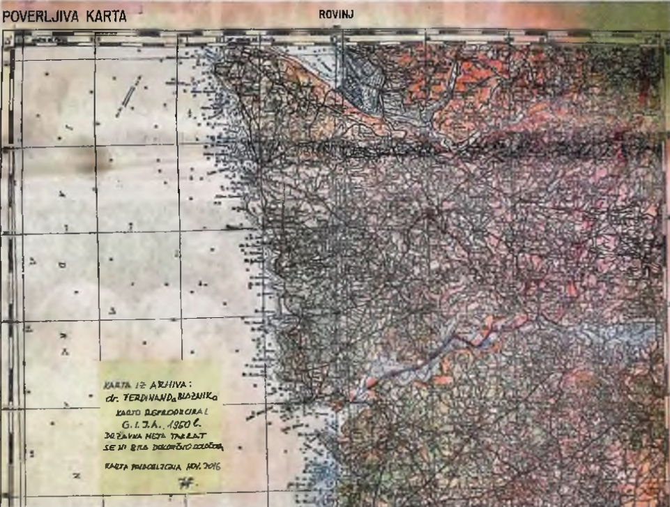
Zaupna karta Beograjskega instituta Jugoslovanske ljudske armade iz leta 1950 vrisuje mejo med Slovenijo in Hrvaško po reki Mirni in pol Istre prisoja Sloveniji; med drugim Novigrad, Buje, Grožnjan ...

V uredništvu hranimo strogo zaupen zemljevid Jugoslovanske ljudske armade iz leta 1950, na katerem je Slovenije v Istri precej več – Medtem ko Makedonci ne smejo imeti vina z imenom teran, ga Hrvati lahko imajo