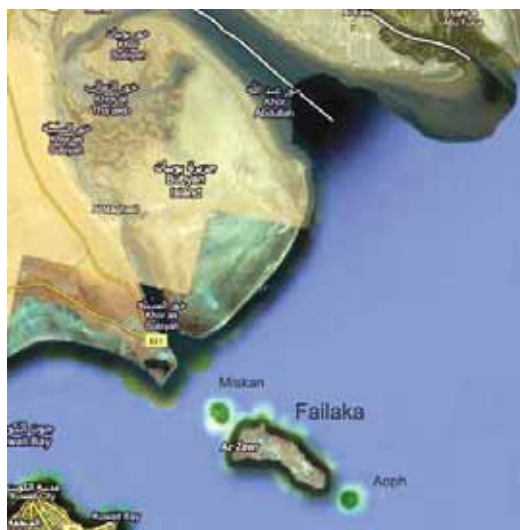
Levo: Atlantidski otok v ustju delte Eofrata in Tigrisa se imenuje Bubiyan. Satelitska slika kaže deloma pogreznjen otok in njegov ravnine grič. Desno: Ključni del svetega otočka se je potopil oziroma postal neprehodno blato, ki obstaja še dandanes.

Atlantida se je izgubila predvsem s prevajanjem in številnimi preimenovanji ter napačnimi razlagami. Namesto da bi govorili o otočju in o svetem otoku »središča sveta«, se danes govori le še o svetem otoku. Atlantida ga je imenoval Platon, a pred tisočletji so ga imenovali drugače. Na otoku padlega angela Failaka so arheologi v kraju Dilmunian našli