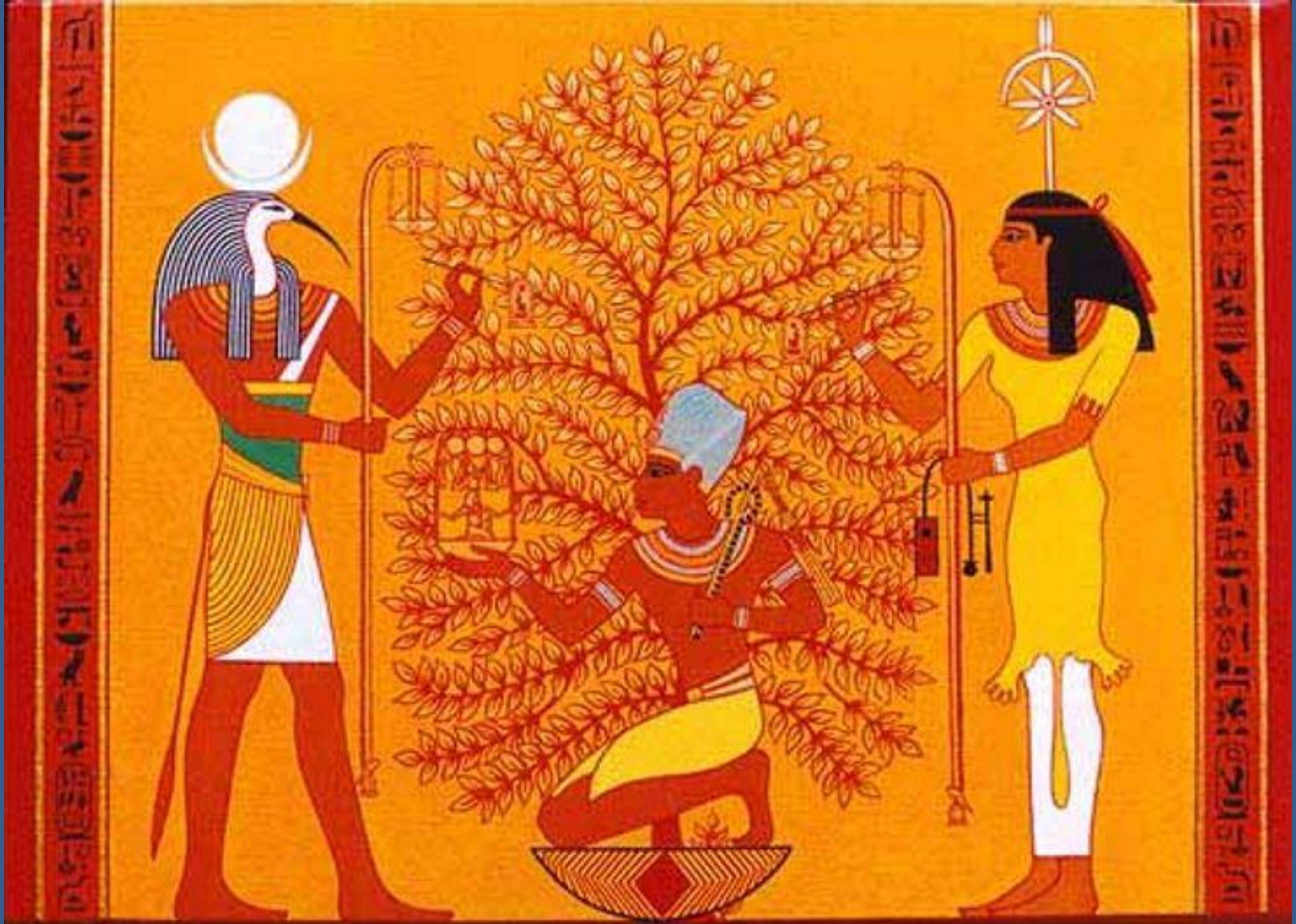
KO ZAZNAVAMO LAHKO TUDI KRASIMO npr. AURO SOČLOVEKA, KOT ZGORAJ TO POČNE SVEČENIK IBIS/TOTH FARAONU.