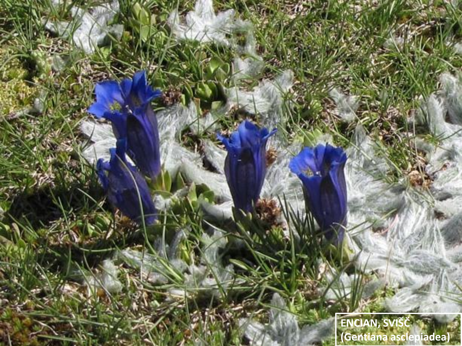
ENCIAN, SVIŠČ (Gentiana asclepiadea)