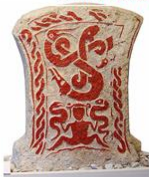
Zgoraj, Keltski Odin, muzej Fornsalen, Visby, Gotland Švedska; spodaj, Veneški konj, Lagole di Calalzo, Italija; desno Keltski „lovilec kač“ Cauldron, 1 st. p.n.št. Danska