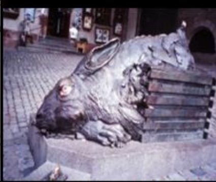
Nürnberg, Berlin, pred „Hitlerjevo“ pivnico