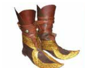
Keltski čevlji 530 p.n.št., z našitim zlatim dodatkom zaklada iz Hochdorf, Zgodovinski muzej Bern, Švica

»Noč ima skrivno moč, prinesel sem ti tvoje čevlje s prišitimi zlatimi krilci na njih. Obuj jih, vojvoda, in povem ti naslednjo zgodbo. Predstavljam si, da letiš daleč v višavah in pogledaš navzdol. Sedaj si zaželi, da je tam spodaj vse urejeno, prerajajoče, kot sonce vsakomur v uteho, spodbudo, da dobro hvališ in slábo grajaš. Si duhovno sonce, um, ki poma-ga naši kulturi, da še naprej raste, v še lepšo našega EL. Poglej meje okrog sebe, tam se tvoj vpliv konča. Imajo svojo kulturo. Izbrali so jo ali pa so v njej pristali. Obišči njihove sončne vodje, morda naredite sonce uma, ki bo sijalo za vse kot