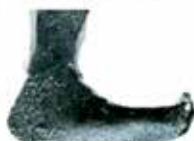
Keltski čevlji, Vič / situla Vače 5.st.p.n.št., Narodni muzej Slovenije