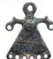
Obesek MA z OBRAZOM ČLOVEKA, Muzej RETIUCEV, Sanzeno, Alto Adige, Italija Zapestnica s presegačo kačo, grob 3/II, 4.st.p.n.št., Kandija, Novo mesto, Slovenija

nega, naše skupnosti, našega O. Naj bo ti lepo.«