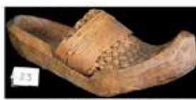
Lesene cokle izdelane 1856 v Ratečah, Slovenski planinski muzej