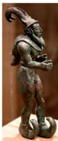
Elamitska kultura, 3.000 – 2.800 p.n.št., zbirka Guennol, muzej Brooklyn, ZDA