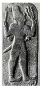
Helitsko božanstvo strele Tarhunda, 9.st.p.n.št.