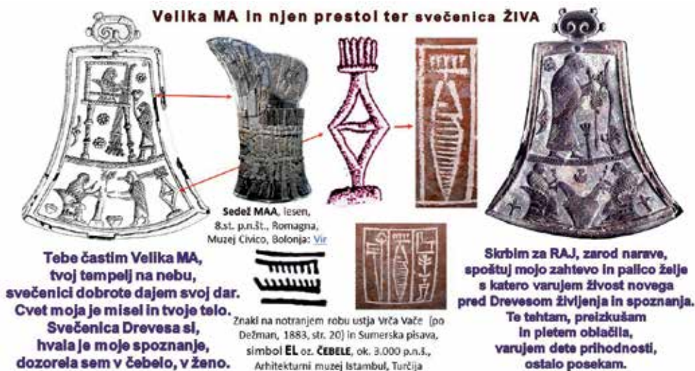
Velika MA in njen prestol ter svečenica ŽIVA