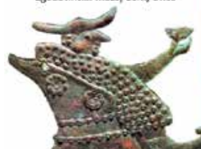
Keltski čevlji, situla Benvenuti iz Este, 6.st.p.n.št., muzej Este, Italija