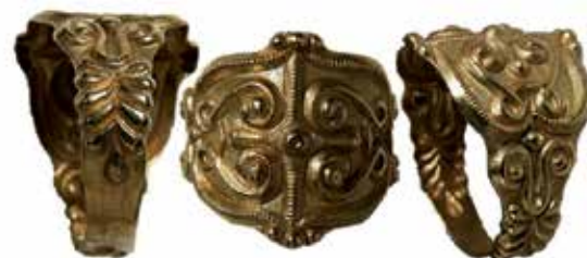
Prstan Velike MA, keltski, 5. - 4.st.p.n.št., 3g, muzej Metropolitan, ZDA