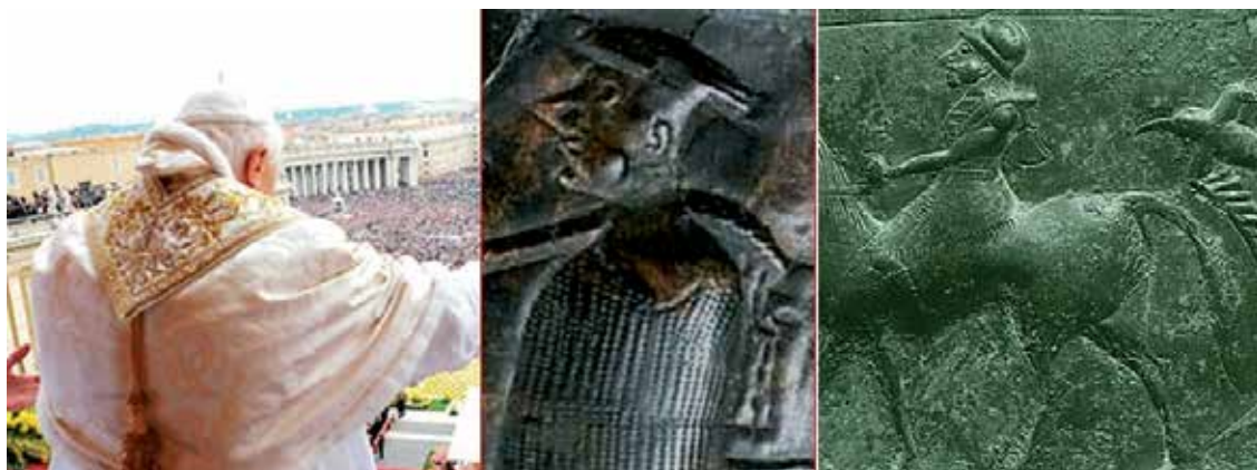
Cof kot simbol božjega sodnika papeža, vojvode, faraona ... Levo je cof na hrbtu papeža pastirja Pavla II. med pozdravljanjem svojih častilcev v Vatikanu; v sredini na hrbtu novega vojvode na Vrču Vače, desno pa na hrbtu vojščaka na situli iz Certose.

Je prvak med konji dobro opravil te hude preizkuse? Je bil še naprej navdih vsem ostalim? Je še naprej dajal seme za razplod vrste? O njegovi usodi govorijo druge upodobitve. Izza prvaka namreč hodi novi izbranec – konj, nad katerim je ptica z Ibisovim kljunom mrtvih. Cof na hrbtu je, kot rečeno, simbol sojenja. Ptič na hrbtu pa simbolizira dušo bitja, ki po njegovi smrti leti skozi ankovo »šivankino uho«.