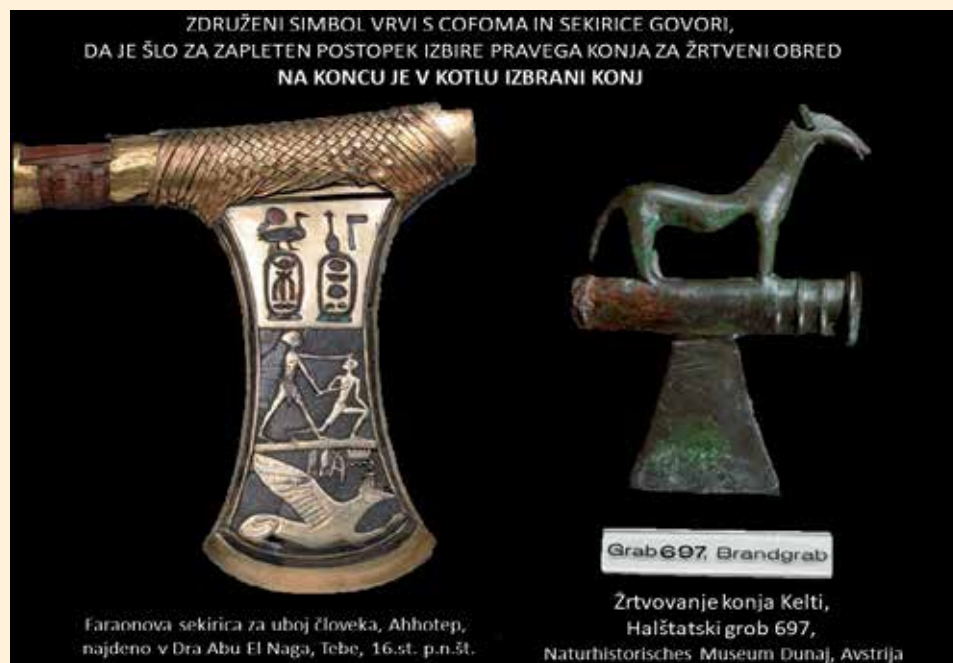
Faraonova sekirica za uboj človeka, Ahhotep, najdeno v Dra Abu El Naga, Tebe, 16.st. p.n.št.