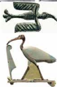
Toth, 4. st.p.n.št., Hermopolis, danes El-Ashmuneln, Egypt, inv. št. 26.7.992, Muzej Metropolitan