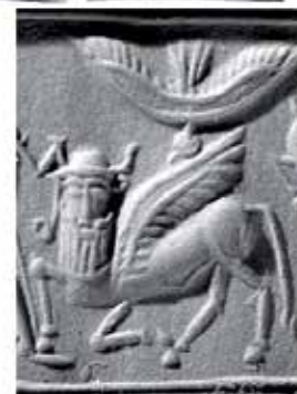
Babilonski pečatnik, 1500 – 1350 p.n.št., kultura Mitanni, Sirija, 1,7 x 1 cm, inv.št. 1987.96.8, Muzej Metropolitan, ZDA