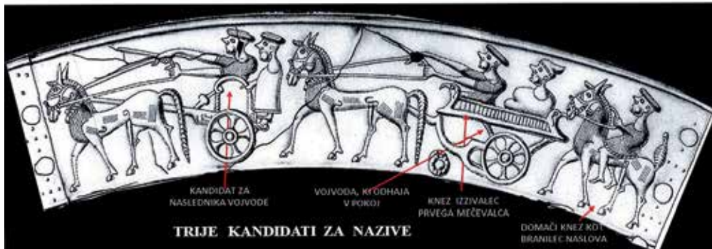
Analiza Vrča Vače – 1. dan: PRIHOD

4. Izbor prvega bojevnika, 5. Sodba živalim in ljudem, 6. Novo rojstvo.