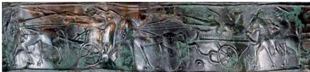
Fotografije Vrča Vače Lauko NMS, računalniška obdelava - združevanje dveh slik Vladislav Stres