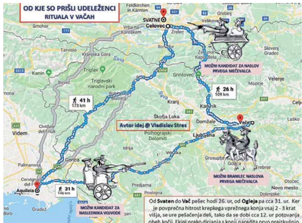
Ilustracija: V. Stres

Orisno dogajanje opišem po sledenju vrstnem redu: 1. Prihod, 2. Začetek obredja, 3. Učenje in potrjevanje znanja,