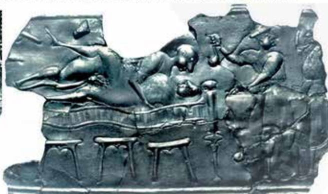
Prikaz obrednega spolnega občevanja na Situli Brezje pri Trebelnem, grob 1-1, 56st.p.s.št., Nar. muzej Dunaj