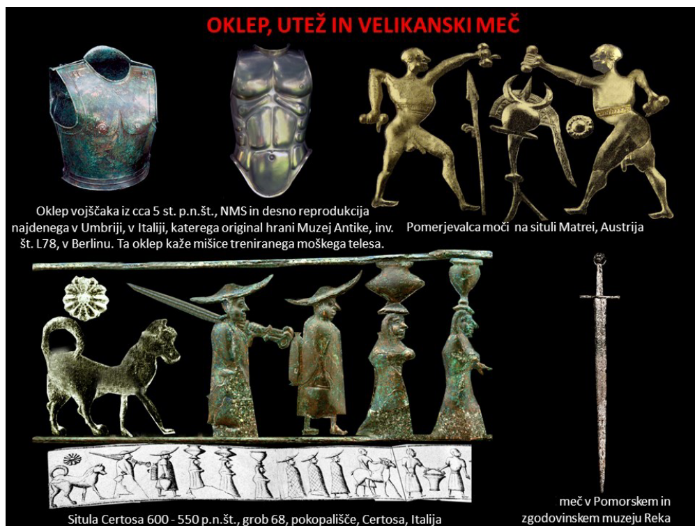
Oklep vojščaka iz cca 5 st. p.n.št., NMS in desno reprodukcija najdenega v Umbriji, v Italiji, katerega original hrani Muzej Antike, inv. št. L78, v Berlinu. Ta oklep kaže mišice treniranega moškega telesa. Pomerjevalca moči na situli Matrei, Austrija

Tako vojvoda kot prvi mečevalec ter knezi so bili v javnosti zelo spoštovani in zanimivi ženskam za nadaljevanje rodu z lastnostmi, ki so jih takrat častili.