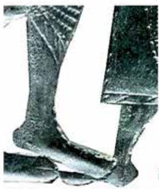
Dotik nog kot prikrit simbol spolne privlačnosti posvečanega v Vojvoda in svečenice „ŽIVE“