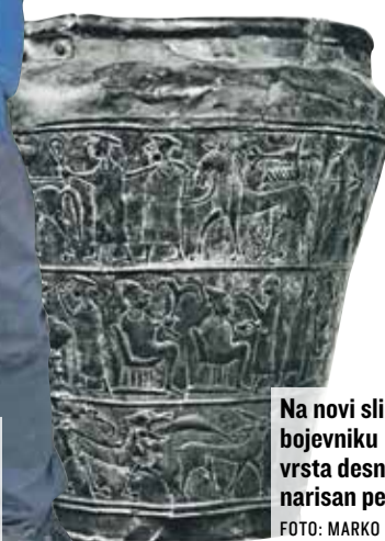
Na novi sliki je pri bojevniku (druga vrsta desno) narisana penis.