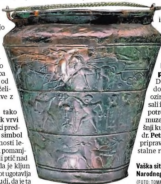
Vaška situla je del stalne zbirke Narodnega muzeja Slovenije.