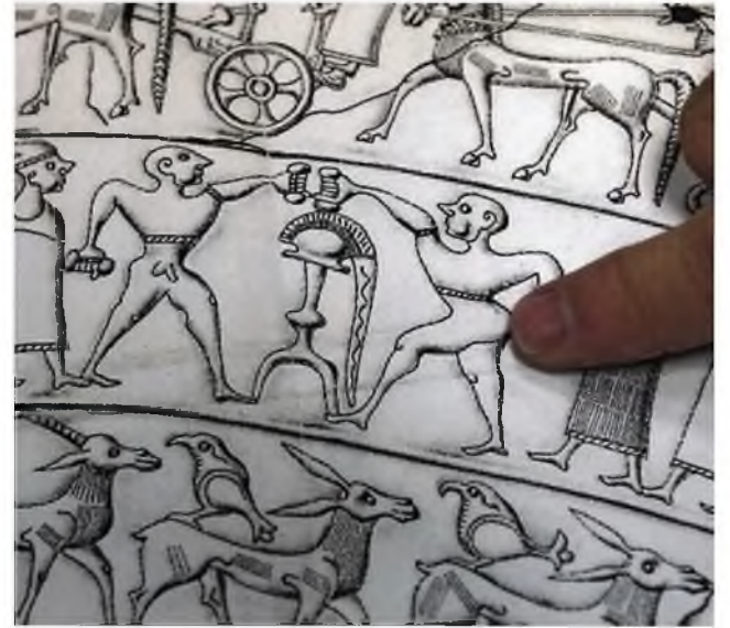
Na tem bojevniku bi moral biti narisan falus.

Samo na tem delu vaške situle so štiri napake: napačno izrisana nosova konjarja (1), napačno pozicionirana noga konjarja (4), manjkajoči košček vrvi pod roko konjarja – simbol angh (3) – in napačno izrisan cof (2).