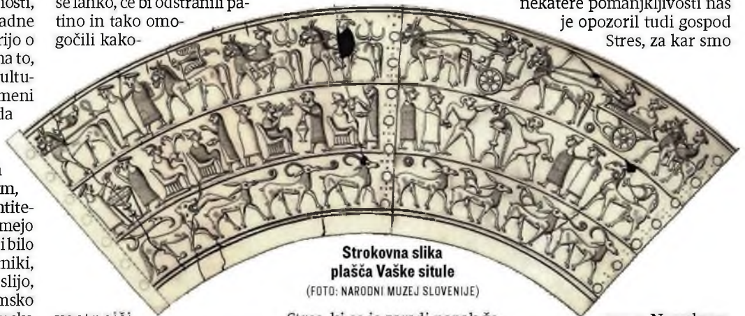
Strokovna slika plašča vaške situle